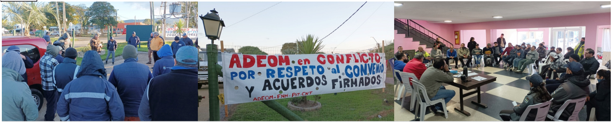
Asamblea y ocupación en Estación Las Flores, en el marco del conflicto.