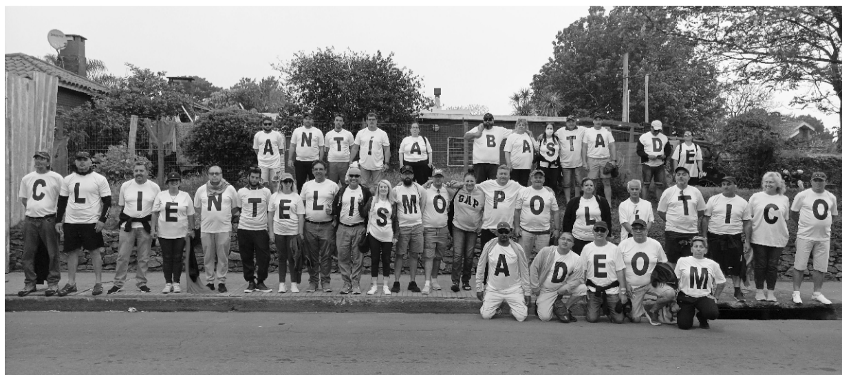
Manifestación en la final de la Copa Sudamericana, contra el clientelismo

LA CLASE RADIO, la radio de ADEOM Maldonado comienza a transmitir con nueva programación. Otro gran paso de nuestro gremio, hoy contamos con un medio radial propio que tiene una importante proyección hacia adelante.