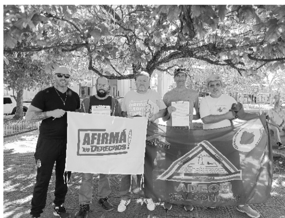
ADEOM en la recolección de firmas

Continuamos con las jornadas de recolección de firmas en Plaza San Fernando de Maldonado, en el marco de la campaña ¡AFIRMÁ TUS DERECHOS!