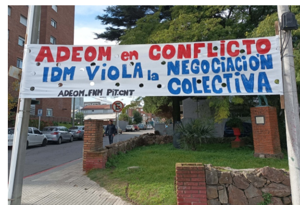
ADEOM en conflicto. Cartelería en la JDM.

Tras un ataque que deja con graves lesiones a un compañero del cuerpo inspectivo, ADEOM se pronuncia en un comunicado. Se convoca a una asamblea de inspectores del sector Tránsito, que se lleva a cabo el viernes 30.