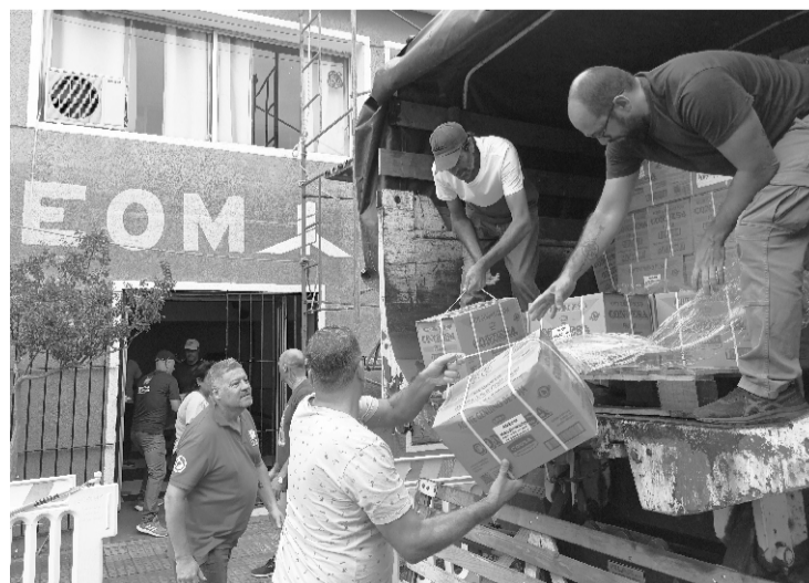
Más de 1.700 set de útiles de estudio entregados

Como todos los años, en el mes de marzo se procedió a la entrega de útiles de estudio a hijas/os de afiliadas/os previo al inicio del año lectivo. Para esta ocasión, se adquirió un total de 1.720 set de estudio (120 pre escolares, 500 escolares, 300 liceales y 800 universitarios) por un monto total de $492.711 .