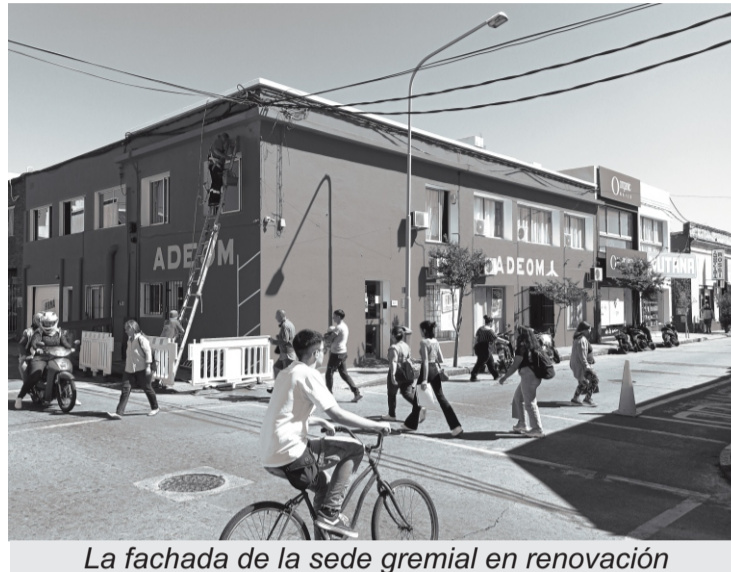
La fachada de la sede gremial en renovación

Compañeras/os municipales afiliados a este sindicato: en función de lo que marcan los artículos 62º y 63º del Estatuto de la Asociación (como es costumbre de esta línea sindical), en la presente edición de “EL FARO”, se realiza el informe sobre lo más destacable de la gestión del Consejo Ejecutivo por el período comprendido entre julio/2023 – junio/2024 , el que será sometido a consideración de la Asamblea General Ordinaria Anual, a realizarse el próximo martes 30 de Julio 2024 . El mismo está presentado de la siguiente forma: