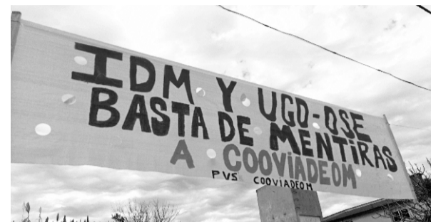
Reclamos de COOVIAD EOM

El viernes 31, se desarrolla una actividad conjunta con ADIM y la Asociación de Celíacos del Interior, sobre diabetes y alimentación saludable, con gran concurrencia en nuestro local.