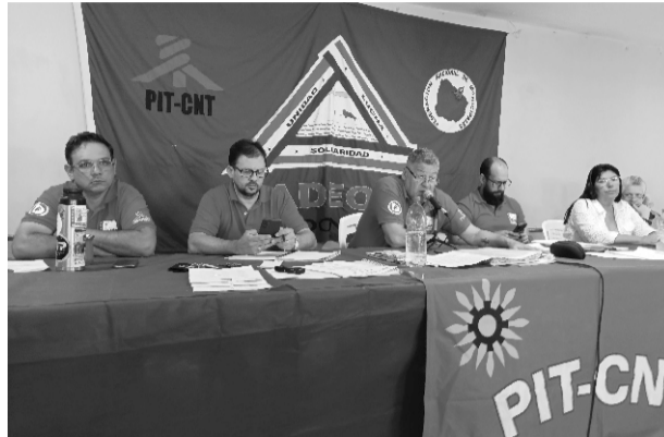
Mesa de la Asamblea General del 21/12

Esta Asamblea aprueba la reforma del Estatuto y rechaza por INSUFICIENTE la propuesta enviada por la Administración, abriendo un compás de espera en las medidas de lucha, en el marco del diálogo que mantiene el Consejo Ejecutivo del sindicato con autoridades municipales.