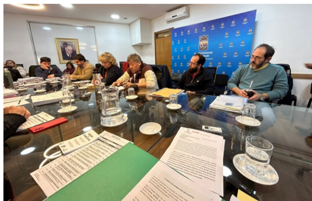
ADEOM en reunión en la Junta Departamental

El 14 de este mes, ADEOM acompaña al Sindicato de Trabajadores de Conaprole (AOEC) en la denuncia penal contra el intendente Antía y el Senador Da Silva por daños y perjuicios e incitación al odio contra ese colectivo.