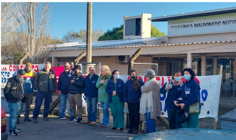
Junto a trabajadoras/es de la Policlínica de Maldonado Nuevo

El sábado 26 se desarrolla otra jornada de