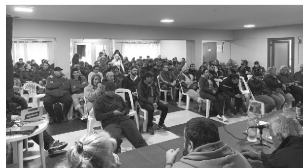
Asamblea General del 30 de mayo