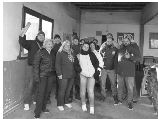
Asamblea en Municipio de Solís Grande

Este mes se realizan asambleas informativas por los municipios de Solís Grande, Las Flores, Pan de Azúcar y Piriápolis. También se recorre y se realizan asambleas en otros sectores (CYLSA, Edificio Comunal, Policlínicas, Campus Municipal).