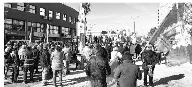
26/7: Acto en el paro del PIT-CNT

ADEOM Maldonado, adhiere, convoca y participa del paro general parcial del 27/6, en el aniversario de la Huelga General de 1973. La plataforma de esta movilización es en defensa de la Democracia, contra la represión y las pesquisas ilegales de este gobierno, a favor del trabajo digno y de calidad, por más salario y presupuesto para la vivienda, la salud y la educación, de cara a un triunfo en el plebiscito por una seguridad social solidaria. En Maldonado, se lleva adelante una concentración frente a la IDM.