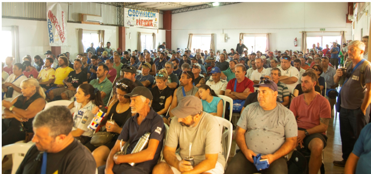
Asamblea General del año pasado, en sede de AJUMM.

Se llevan a cabo jornadas de informando a la población sobre nuestro conflicto con el gobierno departamental de Antía (volanteadas, parlanteadas, ferias, pasacalles). Al mismo tiempo, se organiza una recorrida con entrevistas en los distintos medios radiales y televisivos para dar mayor visibilidad a los reclamos.