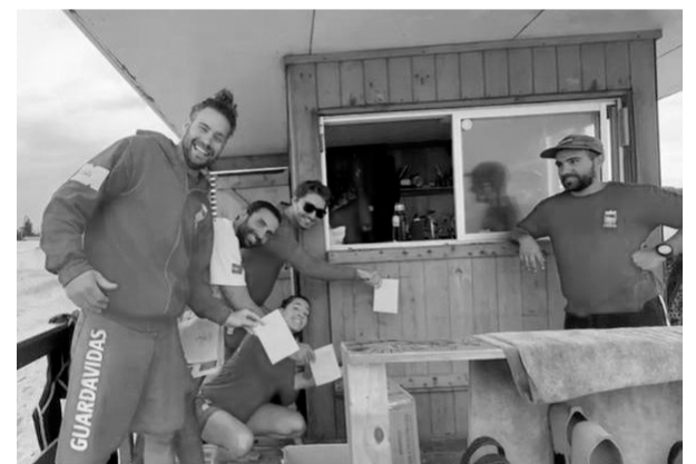
Elecciones de Agrupación de Guardavidas

Se prepara cartelería con motivo del 8 de marzo, Día Internacional de la Mujer.