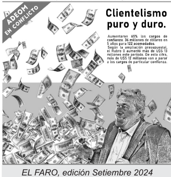
EL FARO, edición Setiembre 2024

El día 20, sale una nueva edición de "El Faro". En días anteriores, representantes de la Directiva llevan adelante una nueva gira por medios locales, explicando la situación de conflicto con IDM.