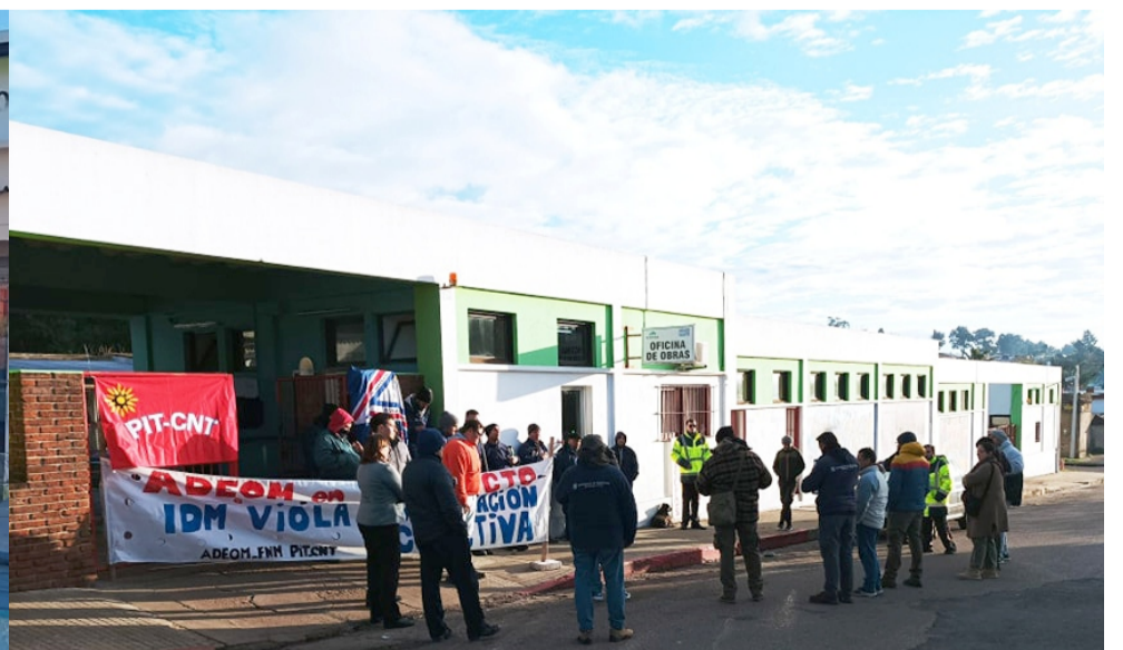
Asamblea y ocupación en el corralón de Pan de Azúcar