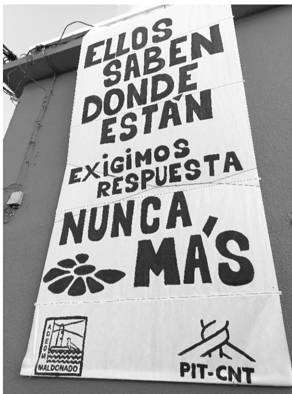
Cartelería por Mes de la Memoria

Con motivo de un nuevo 20 de Mayo, participamos de la "Marcha del Silencio", por memoria, verdad, justicia y nunca más terrorismo de estado.