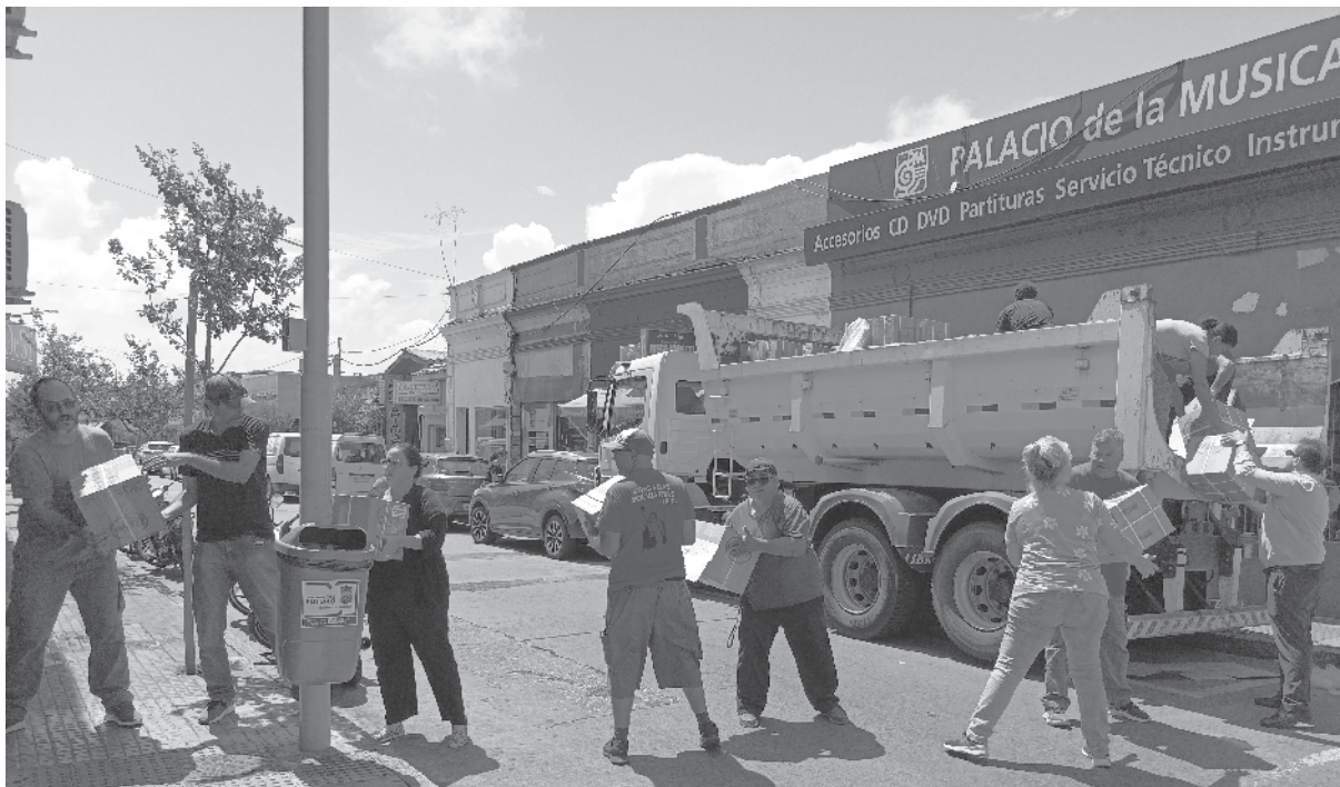
Llegada y descarga de camión con set de útiles en la sede de ADEOM

¡A seguir adelante! ¡Muchos éxitos a todos/as en este nuevo año de clases.