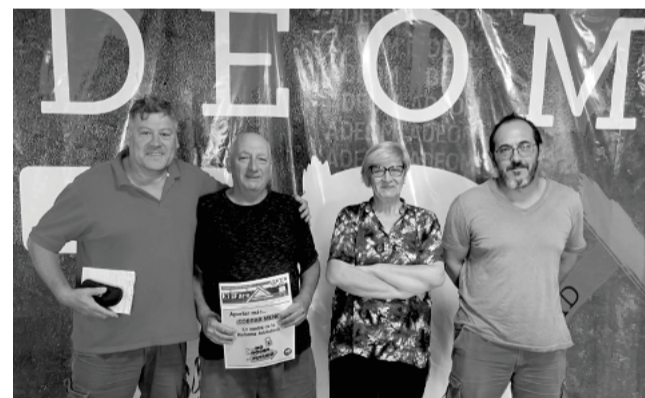
Dirigentes de ADEOM y ADIM, tras reunión.

“Esto es lo que nosotros queremos con todos los gremios, me gustaría que haya más, que escuchen esto y se involucren como ADEOM, porque creo que hay grandes cosas que se pueden hacer con los gremios”, concluyó la presidenta de ADIM.