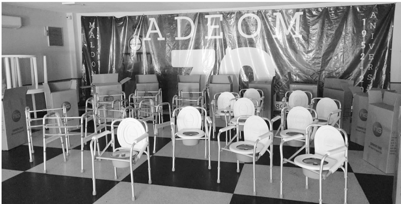
Andadores y sobrewater adquiridos por ADEOM a principios de este año

Otra área sensible que atiende nuestra subcomisión, son las solicitudes de volúmenes de sangre, al amparo del convenio que tenemos suscrito con el Hemocentro. Esto ha permitido dar cumplimiento a los diferentes pedidos, manteniendo de manera seria y responsable el buen cuidado de este tan importante y necesario acuerdo institucional que mantenemos ambas partes. Aprovechando esta instancia, exhortamos una vez más a las/os afiliadas/os de este Sindicato a que se arrimen al Hemocentro y donen sangre, ya que es importante mantener un significativo apoyo humano, el cual luego permite que podamos asistir a padres, hijas/os, cónyuges y al propio afiliado/a, cuando así lo necesita. En el caso de las compañeras, pueden hacer hasta tres donaciones al año y en el caso de los compañeros, pueden hacer hasta cuatro donaciones anuales de sangre. Esto (según acuerdo vigente) le otorga al donante un segundo día libre. También debemos hacer mención que a partir del nuevo reglamento de licencias, el o la trabajadora que opte por ser donante de plaquetas, también estará amparada/o a este régimen con un máximo de cinco donaciones anuales.