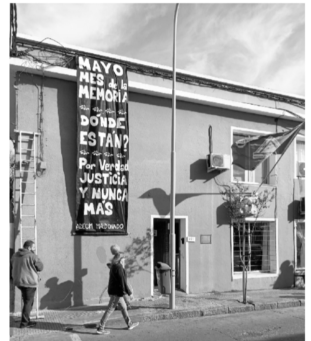
Sede gremial en el mes de la Memoria

En el mes de la memoria, el día 26/05 se realiza en ADEOM un encuentro “Por la memoria y los DDHH” con la presencia de integrantes del colectivo “Voces de Canelones”.