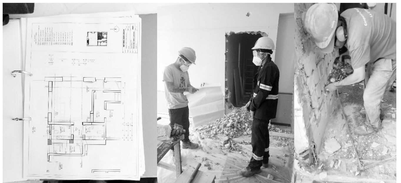
Planos y comienzo de obras para construcción de un baño accesible en el salón de la sede