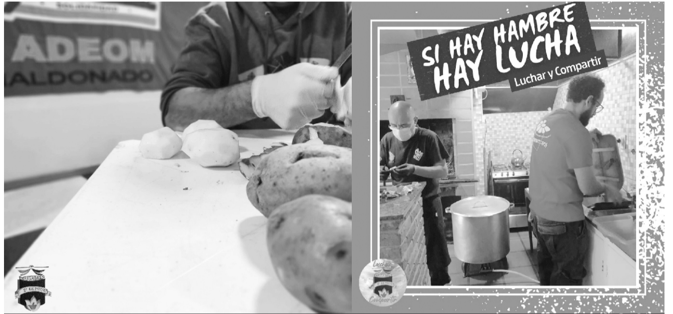
La Brigada 1º de Mayo cada domingo hace una olla popular

El programa de la ANEP “Continuidad Educativa”, ofrece oportunidades educativas a jóvenes y adolescentes entre 18 y 30 años, que se encuentran en situación de discapacidad. ADEOM Maldonado entregó en donación a las/os participantes de este programa, 36 sets de útiles de estudio, siendo este el cuarto año consecutivo que nuestro Sindicato colabora con este programa.