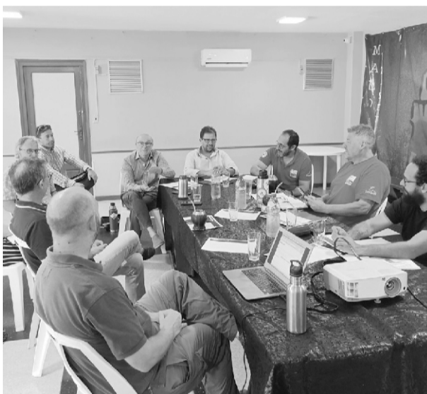
Comisión de Manual de Tareas, hoy dejada de lado por la IDM

Se lleva a cabo un importante intercambio con representantes de ADIM (Asociación de Diabéticos de Maldonado), con el fin de impulsar una campaña de concientización, expresando allí la sensibilidad y el compromiso