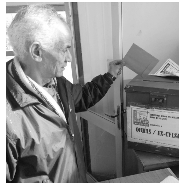
Las elecciones gremiales se celebraron el pasado 31 de octubre

Se llevan a cabo las elecciones de la Institución (período 2022-2024) eligiendo nuevo Consejo Ejecutivo y Comisión Fiscal, siendo la lista más votada la 27-28, que por cuarto período consecutivo retiene la mayoría en ambas comisiones (8 en 9 en Consejo Ejecutivo y 4 en 5 en Comisión Fiscal).