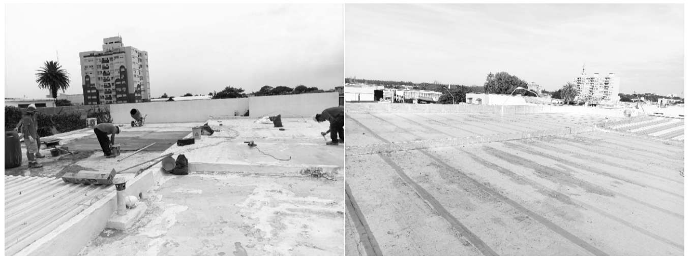
Obras de impermeabilización del techo de la sede sindical de nuestro gremio