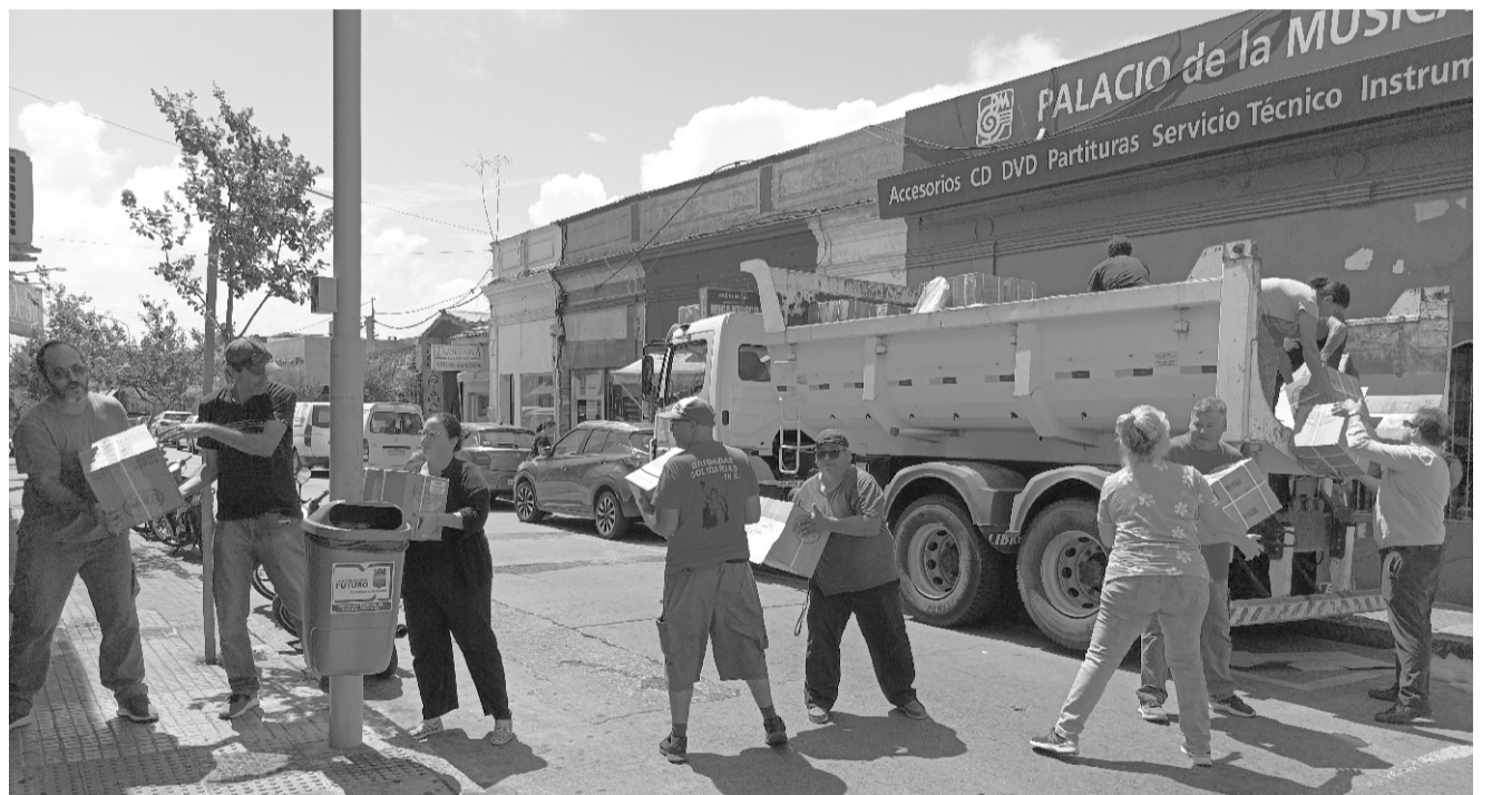
Llegada y descarga de sets de útiles a nuestra sede gremial