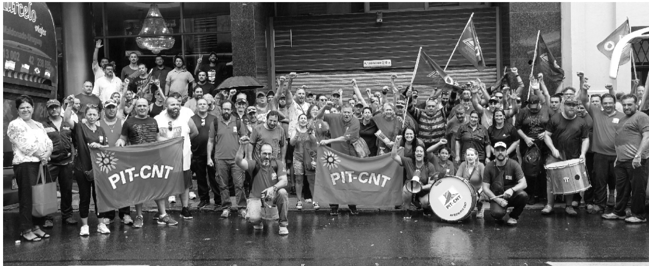
ADEOM en DINATRA (Montevideo), movilización y negociaciones con la IDM