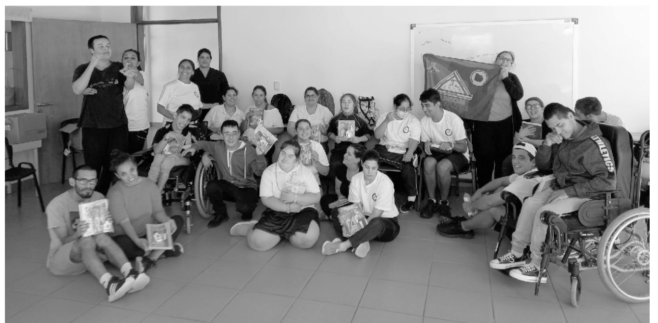
Entrega de útiles a participantes del programa “Continuidad Educativa”